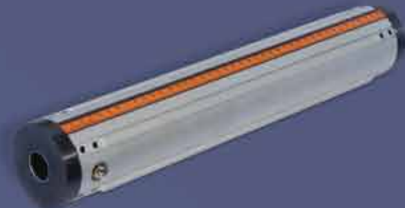
Alüminyum Gövdeli Şaft • Aluminium Shaft

1998 yılında havalı şaft, şişme mil ve pnömatik bobin milleri üretimine başlayan firmamız, Air shaft in 1998, our company started to produce swelling of the shaft and pneumatic been a