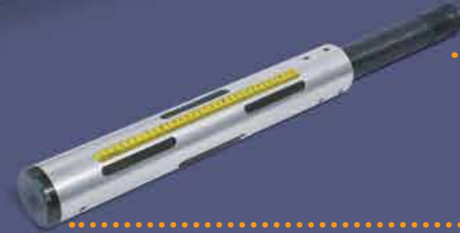
Çelik Gövdeli Havalı Şaft • Steel Body Air Shaft

1998 yılında havalı şaft, şişme mil ve pnömatik bobin milleri üretimine başlayan firmamız, Air shaft in 1998, our company started to produce swelling of the shaft and pneumatic been a