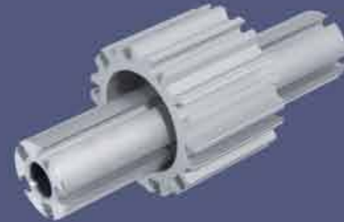
Flanşlı Havalı Şaft • Flanged Air Shaft

1998 yılında havalı şaft, şişme mil ve pnömatik bobin milleri üretimine başlayan firmamız, Air shaft in 1998, our company started to produce swelling of the shaft and pneumatic been a