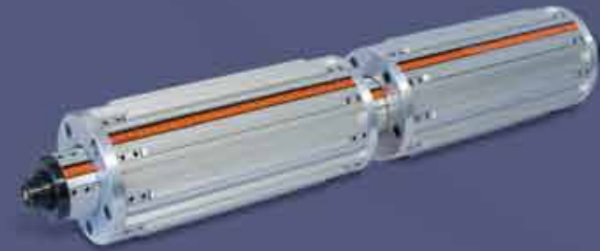
6" Adaptör • 6" Adapter

1998 yılında havalı şaft, şişme mil ve pnömatik bobin milleri üretimine başlayan firmamız, Air shaft in 1998, our company started to produce swelling of the shaft and pneumatic been a